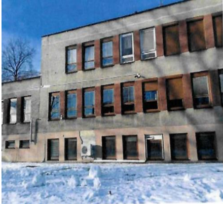
Současný stav objektu