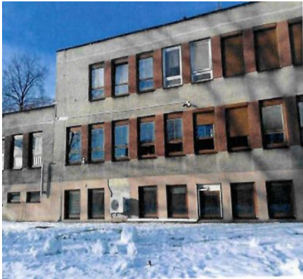
Současný stav objektu